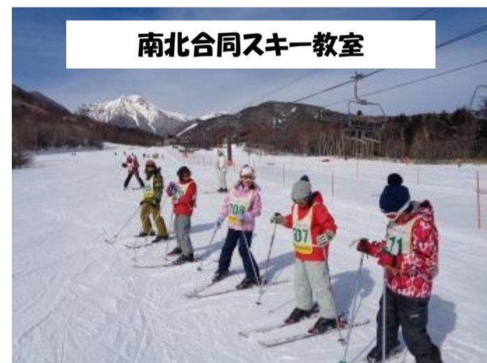
南北合同スキー教室