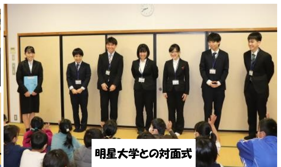
明星大学との対面式